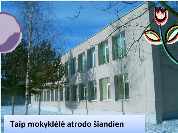
Taip mokyklėlė atrodo šiandien